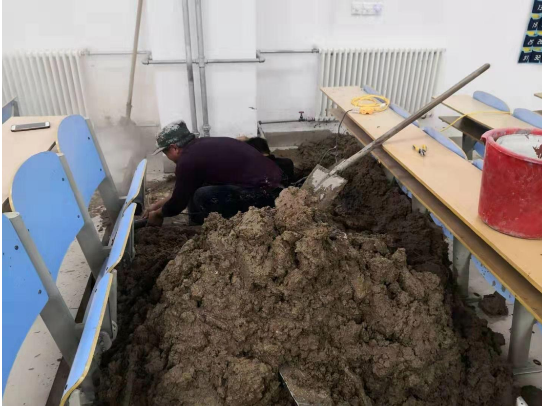
M1 教学楼供暖管道抢修